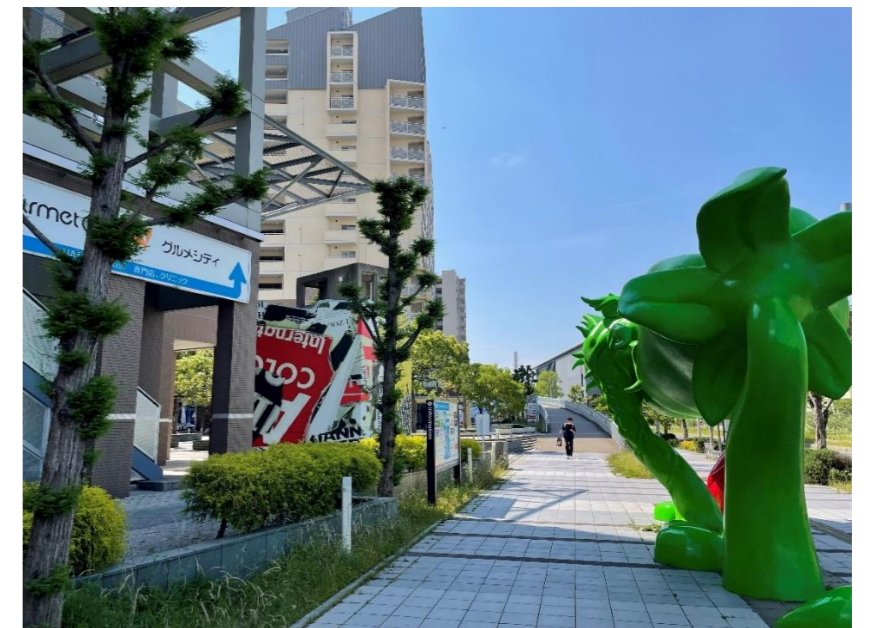
緑色のオブジェがある所で、左に曲がる。