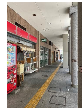
パン屋を過ぎて、 ユーアイ塾の隣