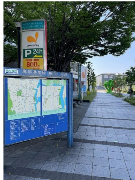
陸橋を渡り、横断歩道を渡ると、 ダイエーの看板が見える。