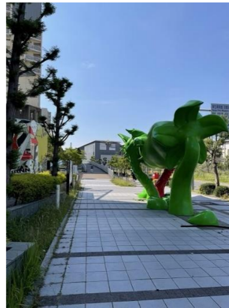
そのまま、まっすぐ歩くと、 緑色のオブジェがある。