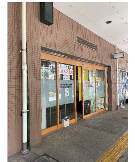
THANK's 事務所 到着!