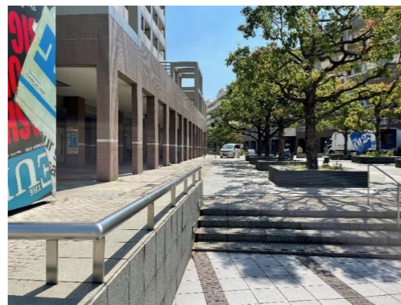
緑のオブジェを左に曲がると、団地内に入る。